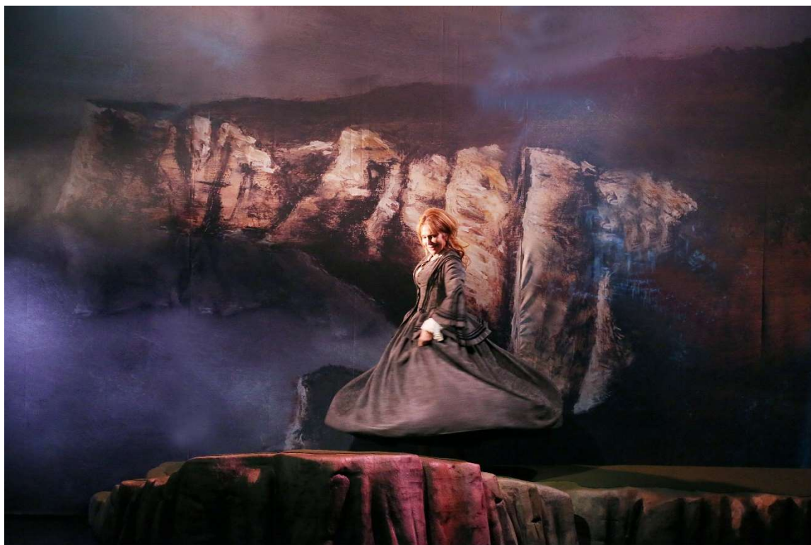
Clémentine Célaré "Une Vie" de Maupassant, mise en scène Arnaud Denis

"La vie, ça n'est jamais si bon ni si mauvais qu'on croit"