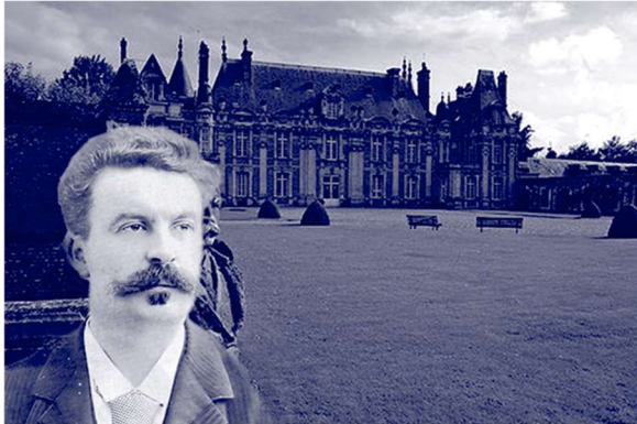
Guy de Maupassant : Château de Miromesnil, Seine-Maritime 1850 – Paris 1893

Guy de Maupassant eut une enfance libre et heureuse en Normandie où il assiste à la débâcle de 1870, puis accepte un emploi de fonctionnaire à Paris. Parallèlement il fait son « apprentissage » littéraire sous la direction de Flaubert ami de la famille, qui lui impose les exigences de l'esthétique réaliste et lui fait connaître Huysmans, Daudet, Zola.. Boule de Suif en 1880, une des nouvelles du recueil collectif Les soirées de Médan, détermine sa vocation de conteur et lui assure le succès.