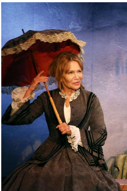
Clémentine Célaré "Une Vie" de Maupassant, mise en scène Arnaud Denis