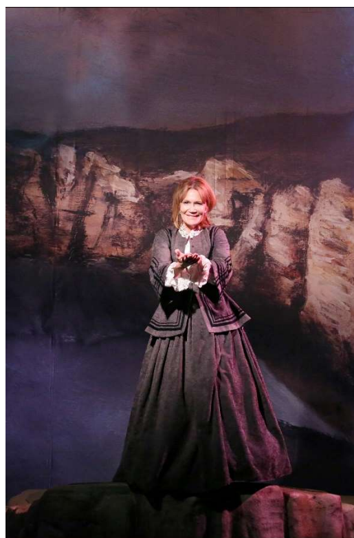
Clémentine Célaré "Une Vie" de Maupassant, mise en scène Arnaud Denis